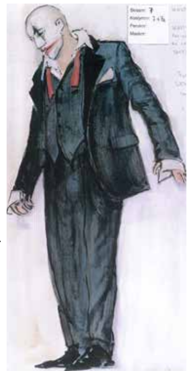
Rigoletto, kostymskiss av Maja Ravn

Det finns bara en sak i Rigolettos liv som betyder någonting och det är hans älskade dotter. Eftersom han vet hur ond världen är vill han skydda henne. Så han håller henne inlåst. Men det får ju såklart motsatt effekt. Hon lär sig inget om livet och blir ett lätt byte för Hertigen.