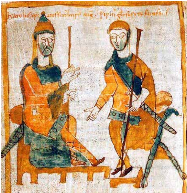
Karl den store och Pippin puckelryggen. Målning från ca 830.