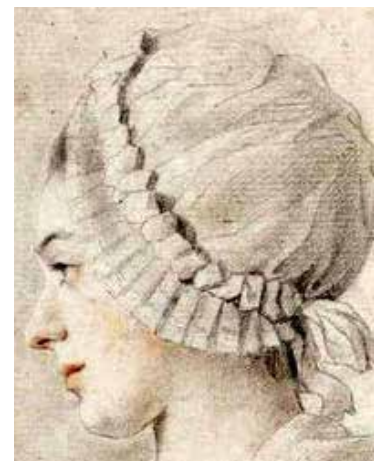
Inspirationsbilder till kostymerna