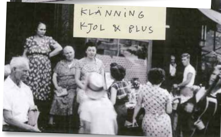
Inspirationsbilder för kostymer till kören i första akten.