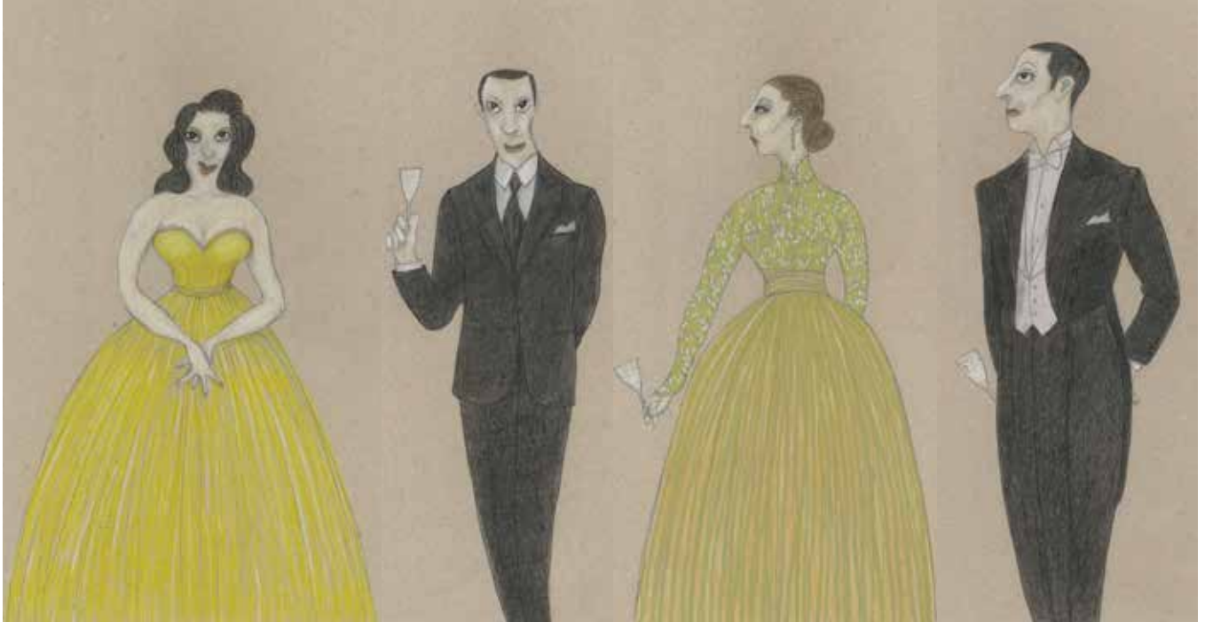
Festkostymer till tredje akten.