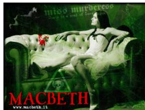
Skivomslag av det italienska Black Gothic Metal-bandet Macbeth

"Goth is an alternative subculture; it is both a style of music and a fashion, like Punk. People who listen to the music don't necessarily dress in the style, and people who look like goths don't necessarily like the music either - a lot of metal fans have adopted the goth look, making for a great deal of confusion. However, on the rare occasion that someone looks like a goth and likes goth music, chances are they're actually a goth."