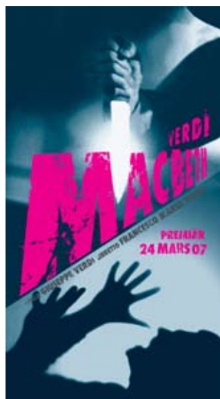
...och Malmö Operas Macbeth-affisch.