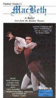
Bolshoi balettens version av Macbeth.